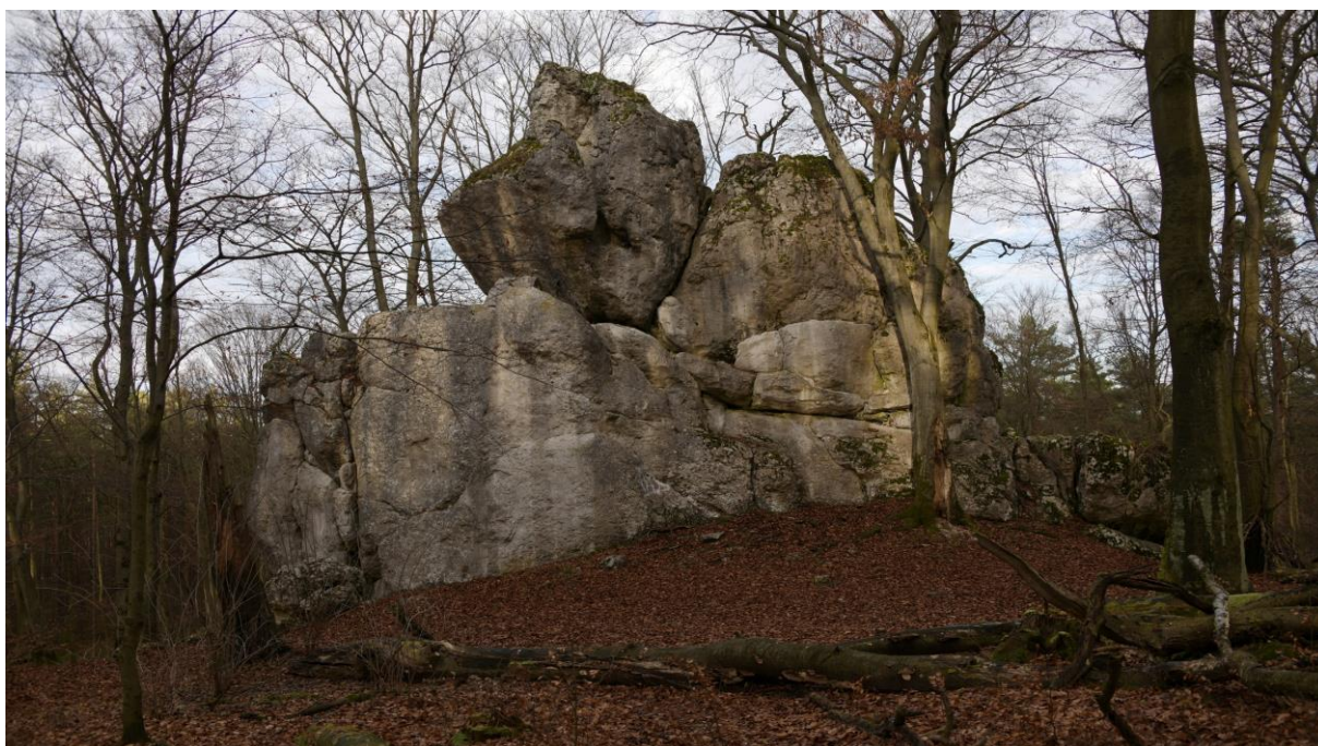
Bryłowa forma skalna o nazwie Pielgrzym, 15 m. wys. udostępniona do wspinaczki, widok od strony południowej