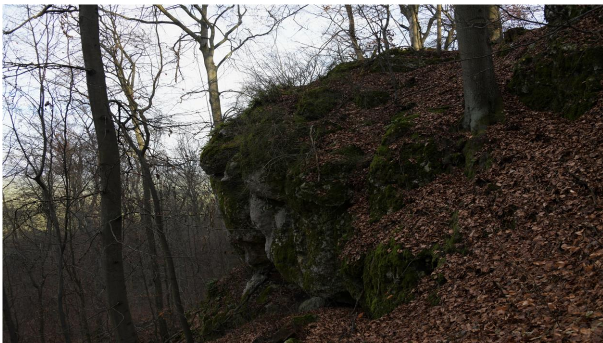
Zwietrzała ściana skalna w ciągu form ostańcowych