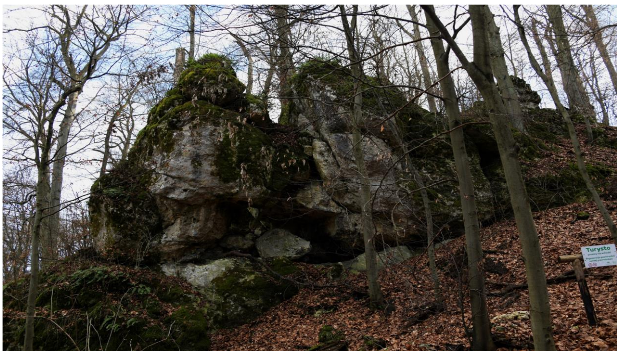
Bryłowo-piramidalna forma skalna - pn. strona wzgórza o nazwie Sokola