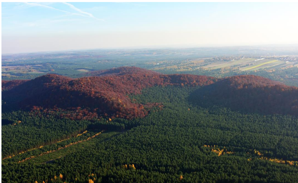
Rezerwat Sokole Góry