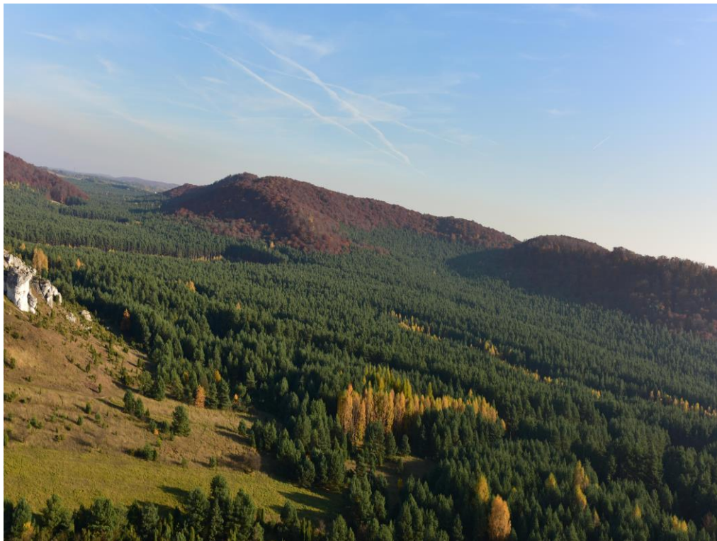
Rezerwat Sokole Góry, urozmaicenie terenu z bujnymi lasami. Widoczne wychodnie skalne podkreślające atrakcyjność terenu.